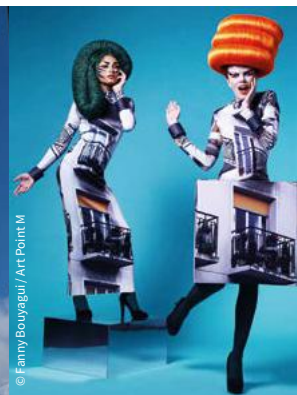
© Fanny Bouyagui / Art Paint M