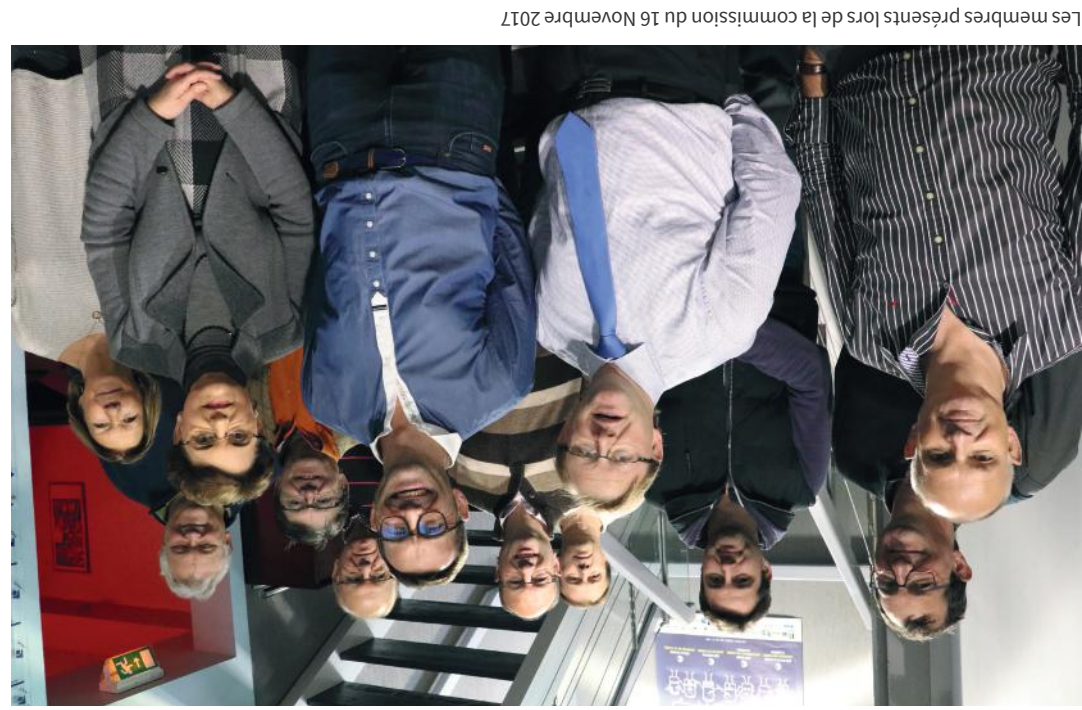
Les membres présents lors de la commission du 16 Novembre 2017

Dynamique, conquérante et innovante, la commission commerce est composée de chefs d'entreprise et de représentants des unions commerciales. Certains sont élus de la CCI.