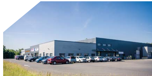
Hôtel d'entreprises Le Tarmac