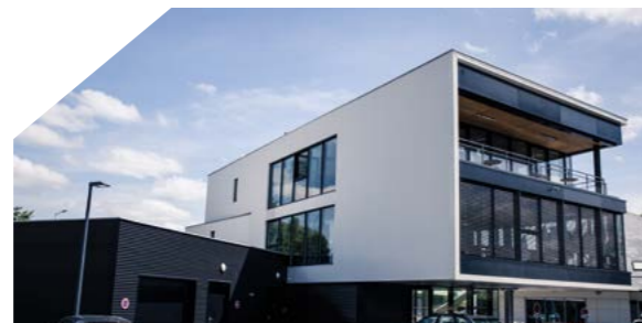
Hôtel d'entreprises Le Conquérant