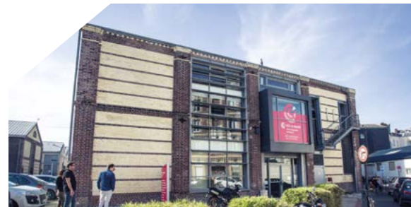
Hôtels d'entreprises Dombasle 1 & Dombasle 2