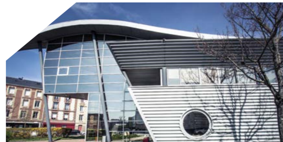
Pépinière d'entreprises Le Vaisseau