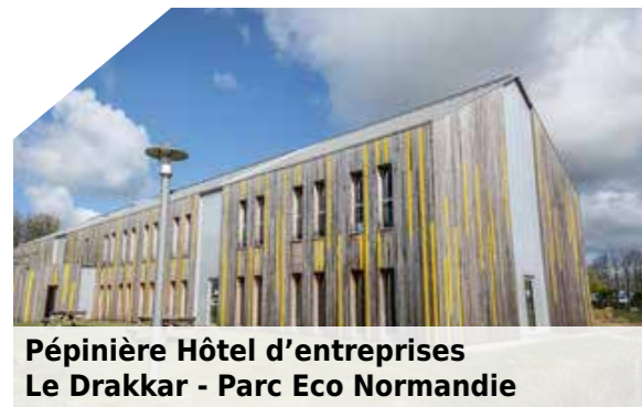
Pépinière Hôtel d'entreprises Le Drakkar - Parc Eco Normandie