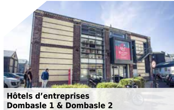
Hôtels d'entreprises Dombasle 1 & Dombasle 2

Le Havre - Centre-ville et quartiers Sud