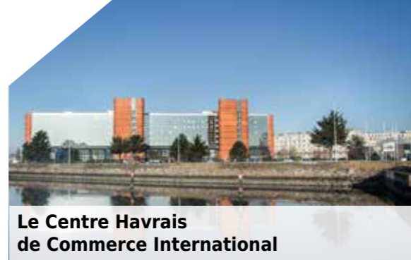
Le Centre Havrais de Commerce International