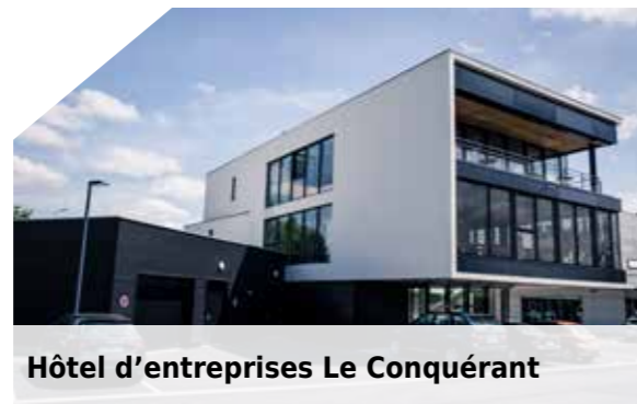
Hôtel d'entreprises Le Conquérant