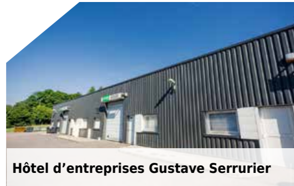
Hôtel d'entreprises Gustave Serrurier