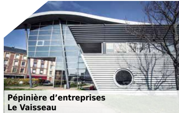
Pépinière d'entreprises Le Vaisseau