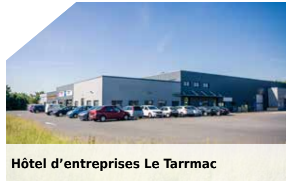
Hôtel d'entreprises Le Tarmac